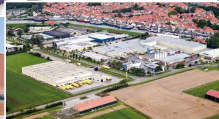
Instalaciones de Zeelandia en Zierikzee, Holanda.