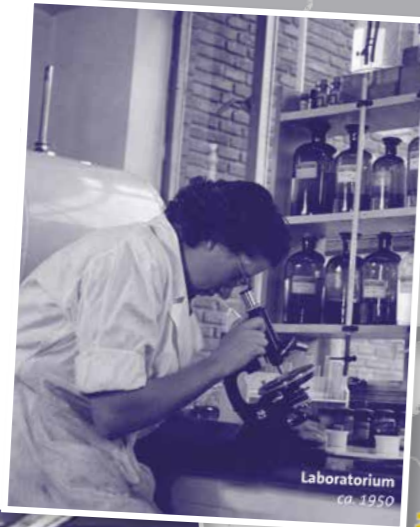
Laboratorium ca. 1950.