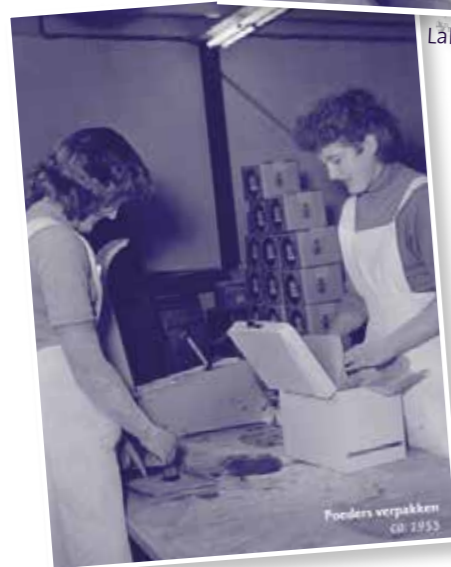
Trabajadoras envasando. 1955.