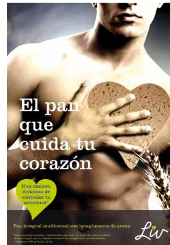
Cartel para el punto de venta.