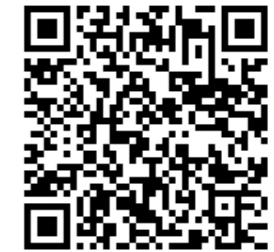
Vídeo sobre la elaboración de Pastelitos en forma de Polo