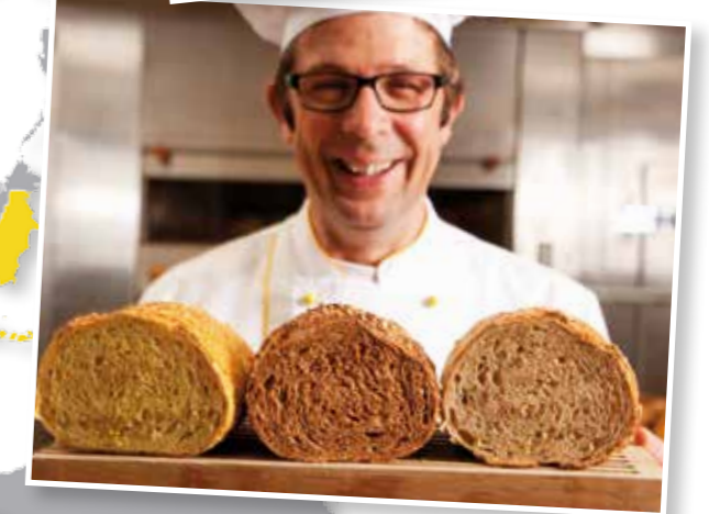
El excelente soporte técnico de Zeelandia acompaña a panaderos y pasteleros de más de 70 países a nivel mundial.