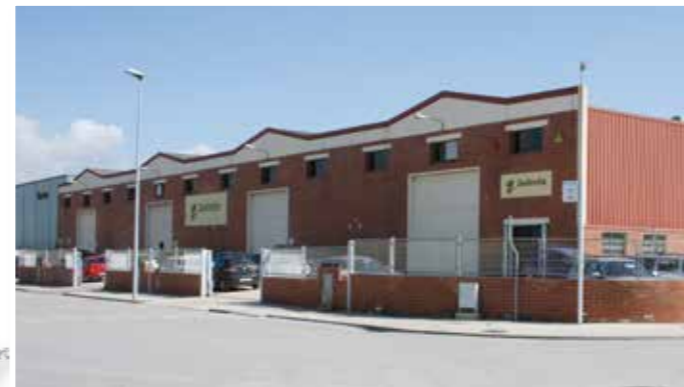
Instalaciones de Zeelandia en Santa Margarida i els Monjos, España.