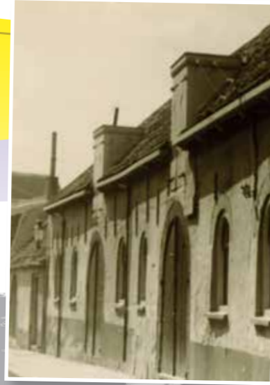
Primeras instalaciones de Zeelandia. 1920.