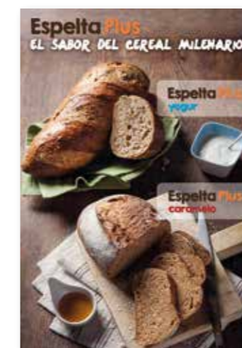
Cartel para el punto de venta

Material promocional para el punto de venta: